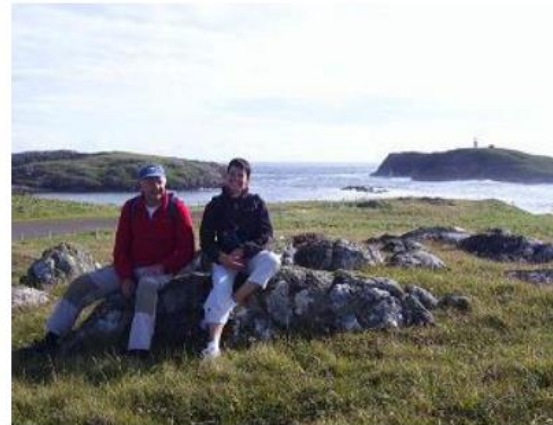
Iles Shetland – Out Skerries