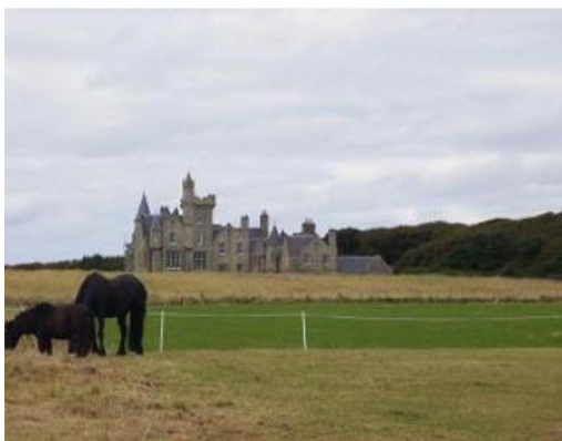
Iles Orcades - Shapinsay