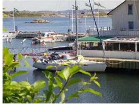
Suède - Karingon