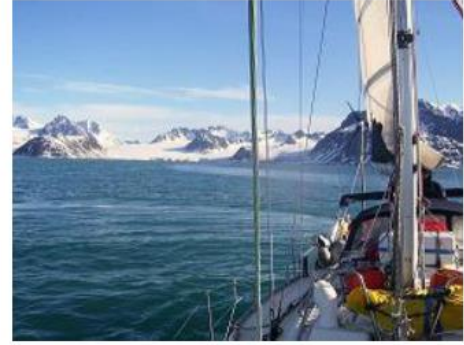
Spitzberg - Baie de la Madeleine