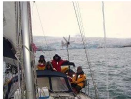
Spitzberg - Pyramiden