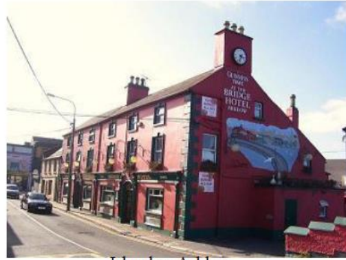
Irlande - Arklow