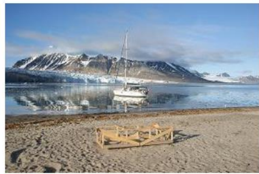
Spitzberg - Blomstrandhamna