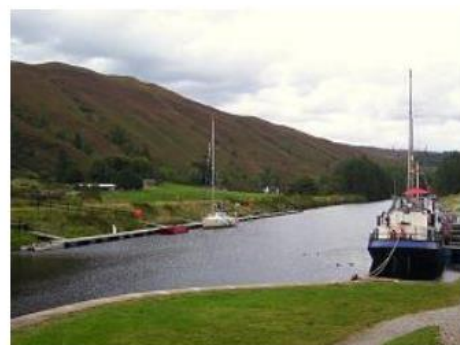
Ecosse - Ecluse Canal Calédonien