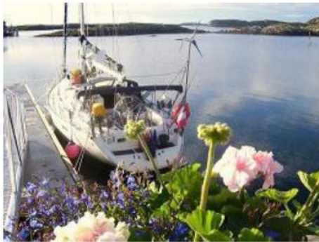
Norvège - Ile de Lovund