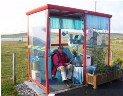
Iles Shetland – Ile d'Unst