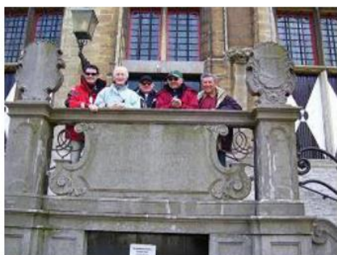
Pays-Bas - Veere

Voilà quelques moments des plaisirs glanés au fil des navigations.