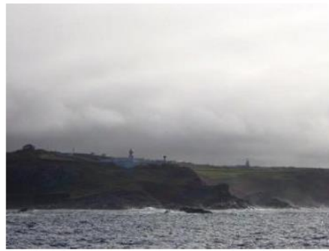
Cornouailles - Cap Lizard