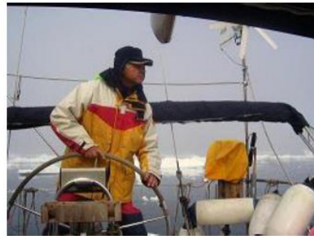
Mer de Norvège dans les glaces flottantes