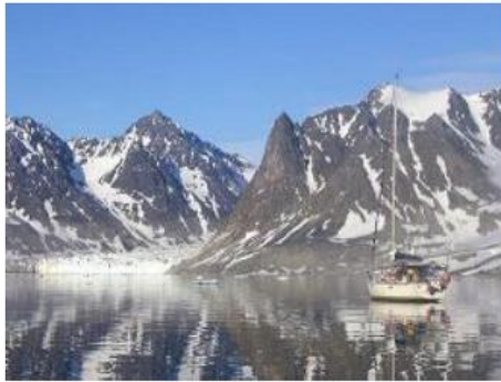
Spitzberg – Trinityhamna