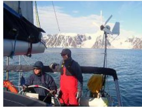
Spitzberg – Trinityhamna