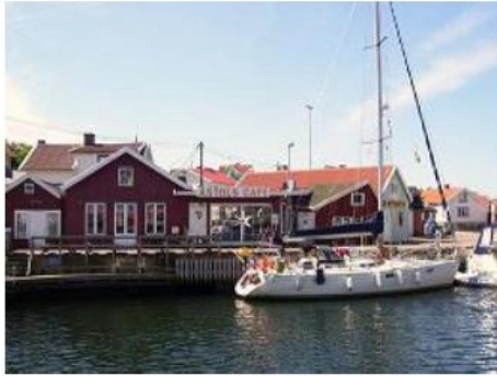
Suède - Ile d'Astol