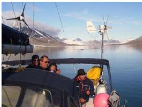
Spitzberg - Blomstrandhamna