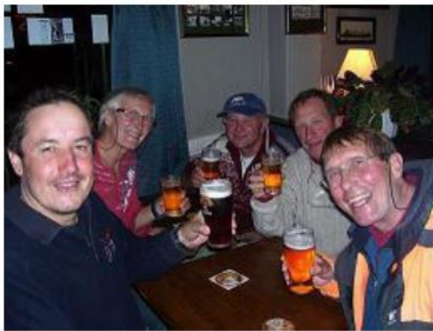
Royaume-Uni - Swansea