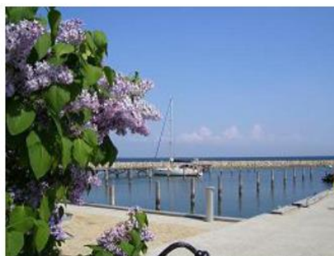
Danemark - Ile de Vejro