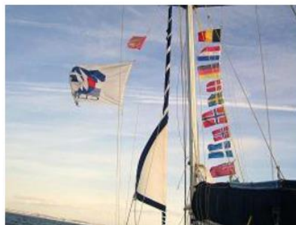
Retour au Havre