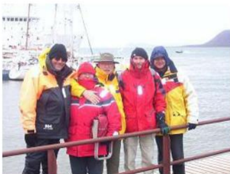
Spitzberg - Longyearbyen