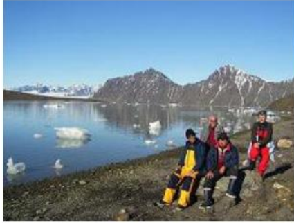
Spitzberg - Signehamna