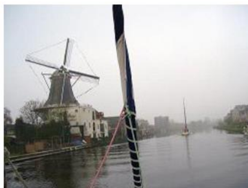
Pays-Bas - Standmaastroute