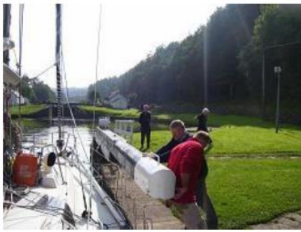
Ecosse - Canal Crinan