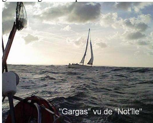
"Gargas" vu de "Not'île"

Petite visite avant et après le déjeuner à Portsmouth, petite sieste, et nous voilà prêts pour une nouvelle transmanche vers Le Havre. Cette fois-ci cap au 150 ; le peu de vent nous oblige à garder le moteur. Malgré tout, nous sommes en avance sur nos prévisions ; un bon coefficient de marée (92) nous a dopé la vitesse. Contact est pris avec « Gargas » le First 35 skippé par Stéphane pour organiser une partie de pêche et un mouillage déjeuner devant la plage du cap d'Antifer. 15h00 les courants nous sont favorables et nous entamons l'ultime navigation vers le bercaill sous le signe de la régata. Nous prenons l'option bord à terre avec le génois tangonné et « Gargas » l'option grand largue avec plus de vitesse mais